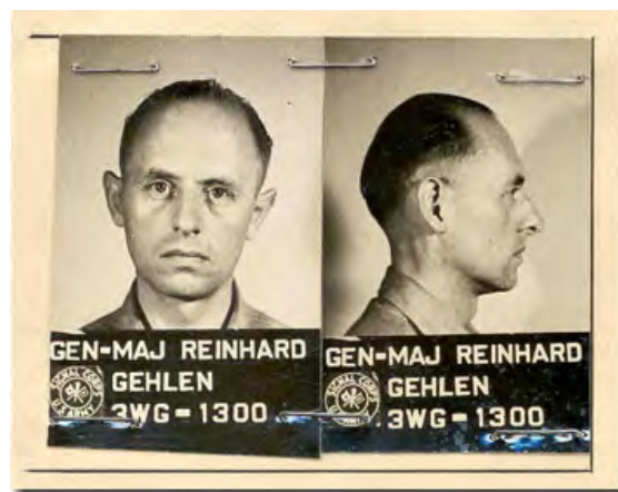
Reinhard Gehlen 1945 (vom United States Army Signal Corps angefertigte Fotos aus Gehlens Kriegsgefangenenakte)

Ab Oktober 1944 plante Gehlen für die Zeit nach dem Krieg. Dafür entwickelte er eine Hypothese, die sich später als richtig erwies: „Die Westmächte werden sich gegen den Verbündeten Russland wenden. Dabei werden sie mich, meine Mitarbeiter und meine kopierten Dokumente im Kampf gegen eine kommunistische Expansion benötigen, weil sie selbst keine Agenten dort besitzen.“